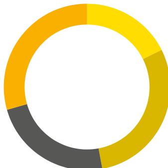
REALIZACIJA AKTIVNOSTI PREMA MONITORINGU