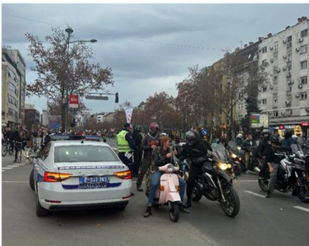
Saobraćajna policije i motorciklisti na obodu protesta