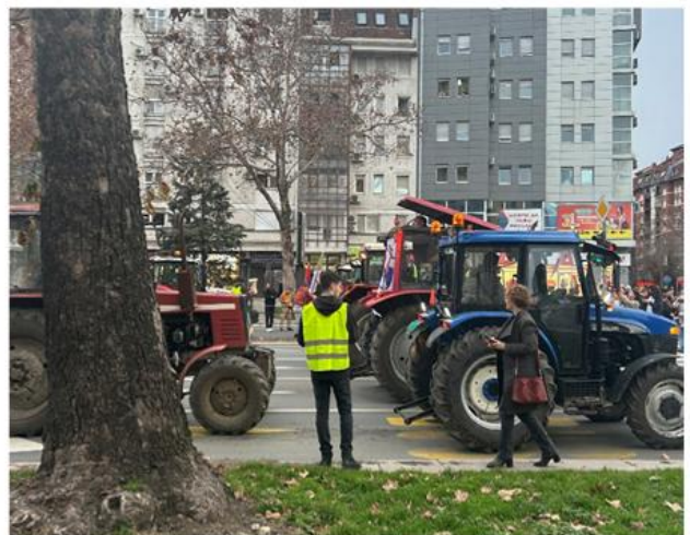
Traktoristi koji obezbeđuju protestnu kolonu