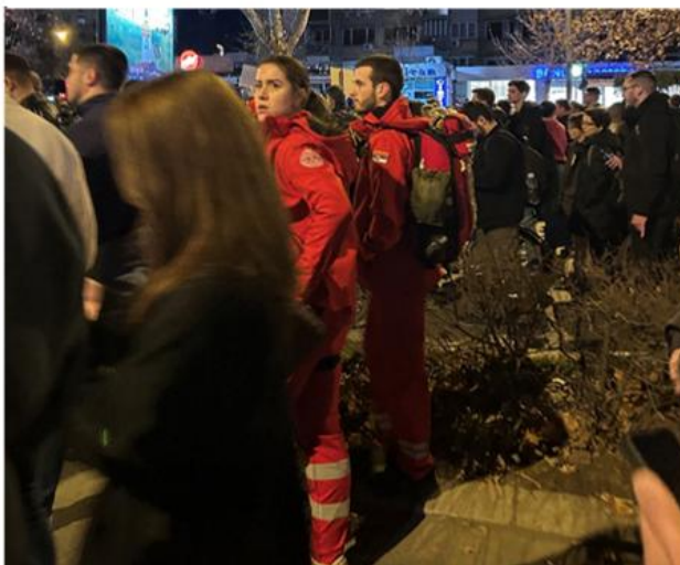
Mobilna ekipa hitne pomoći