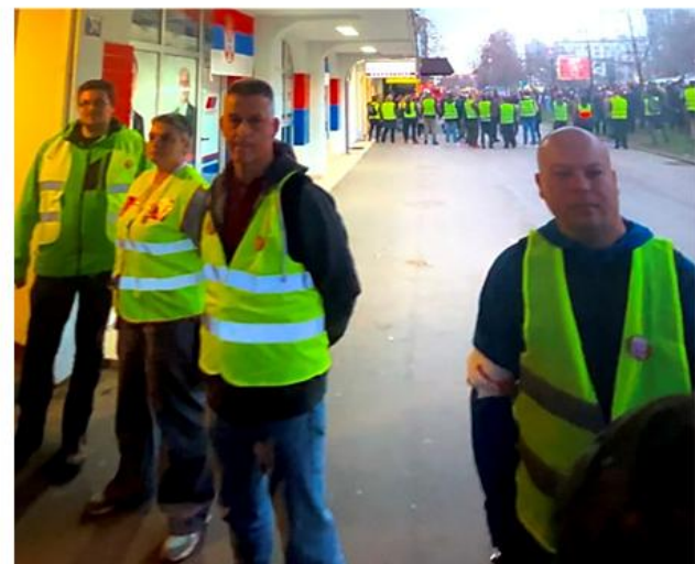
Redari koji obezbeđuju prostorije SNS-a