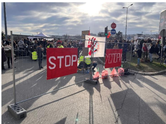
Građevinska ograda kod ulaza u Južni bulevar