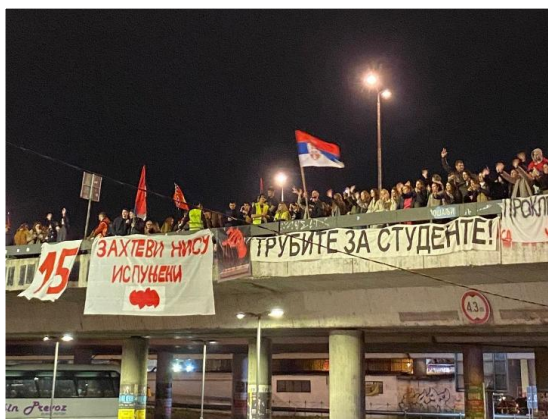
Transparenti na protestu