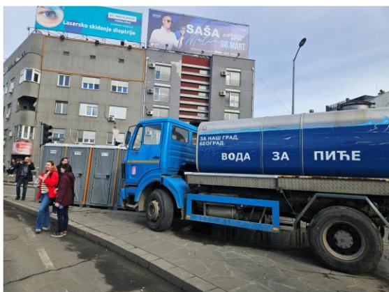
Mobilni toaleti i cisterna za vodu