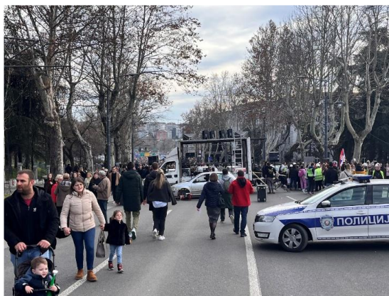
Ulaz na protest kod Veterinarskog fakulteta