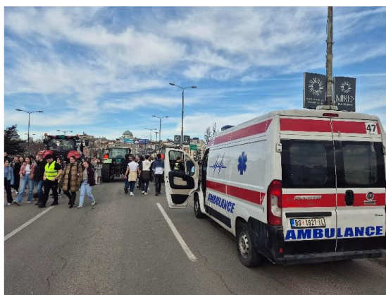
Kola hitne pomoći na protestu