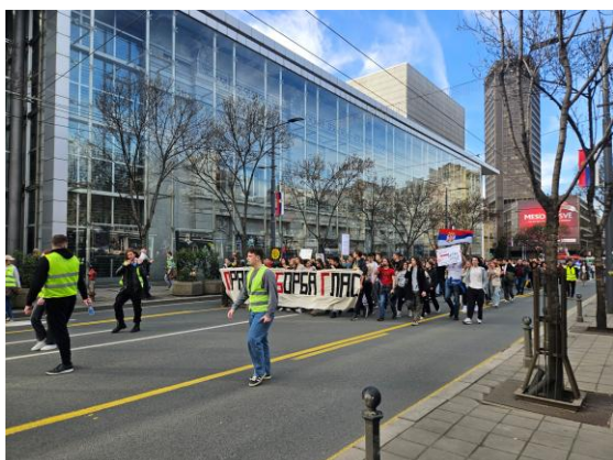
Sprovođenje kolone učesnika protesta kod JDP-a