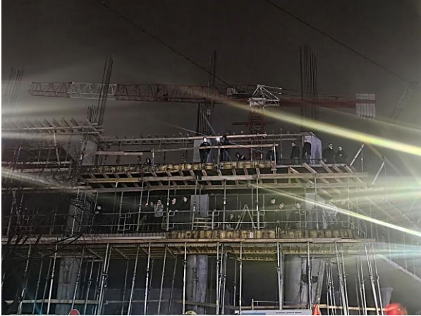
Kontra-demonstranti na gradilištu