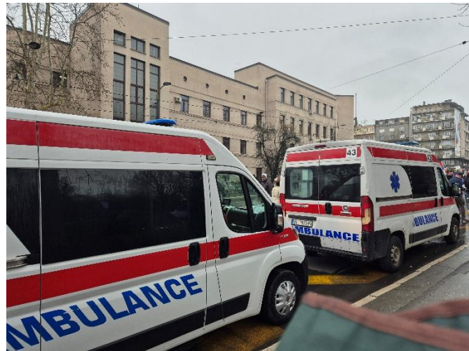
Kola hitne pomoći kod pravnog fakulteta