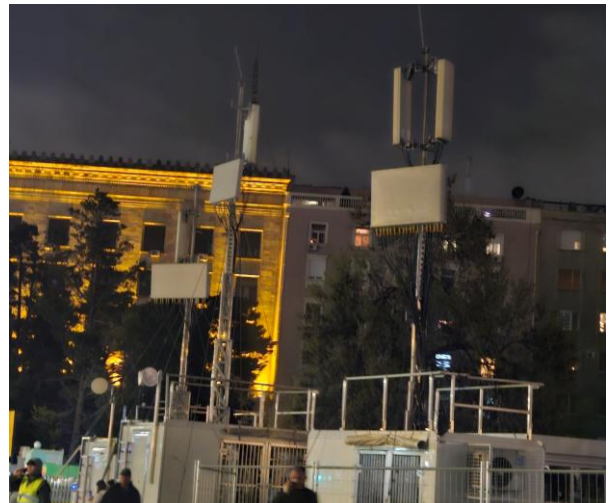
Mobilne bazne stanice