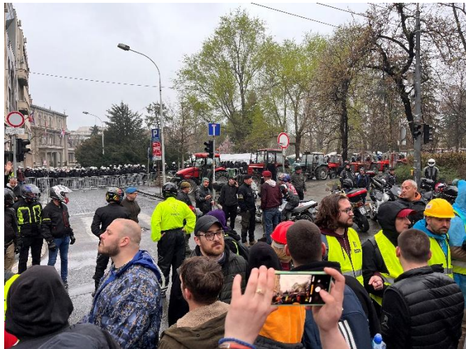
Okupljeni građani ispred Pionirskog parka