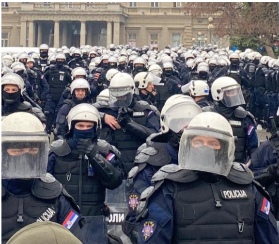
Policija ispred gradske skupštine