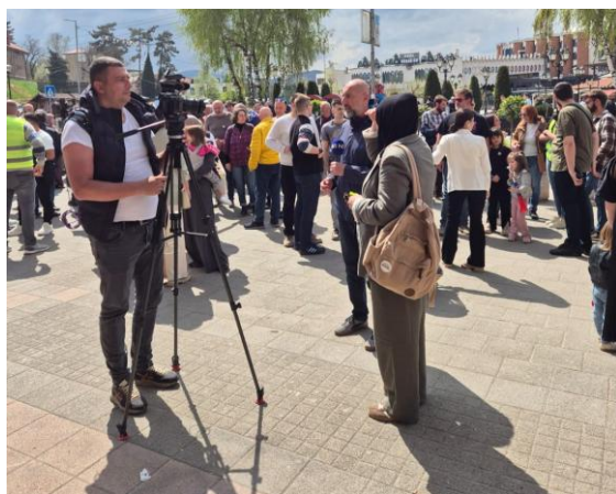
Mediji na protestu