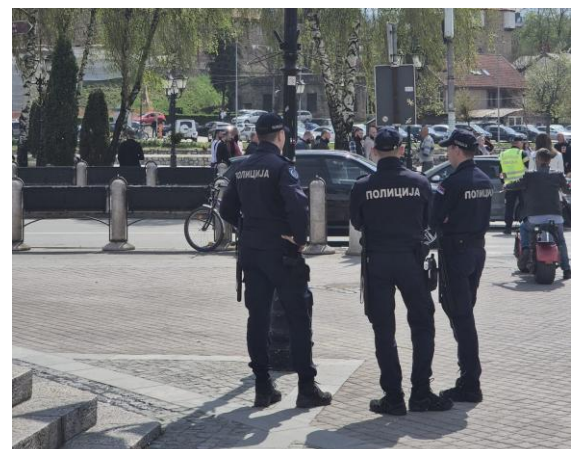
Policija na protestu