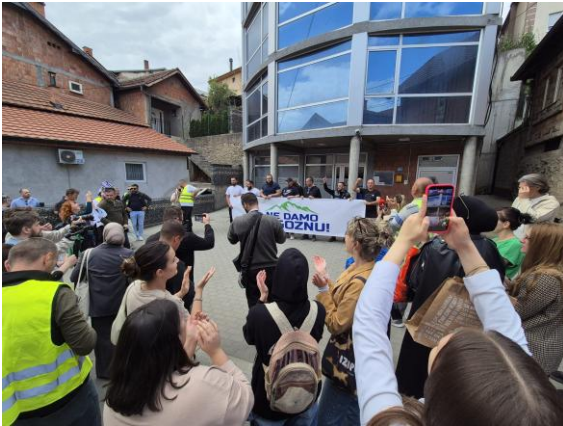
Učesnici protesta ispred sedišta kompanije Zlatna Reka