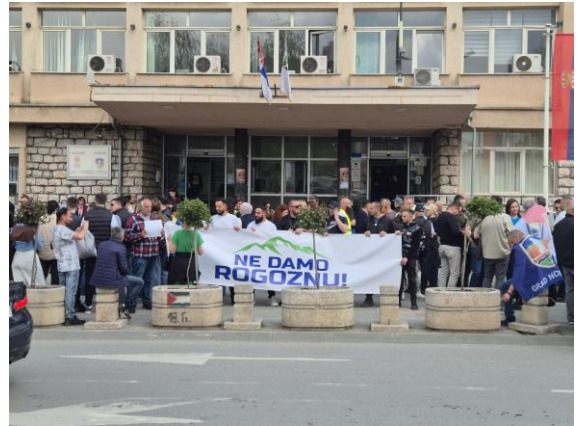
Učesnici protesta ispred zgrade gradske uprave