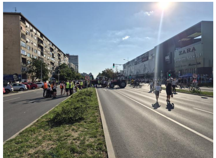
Redari na protestu