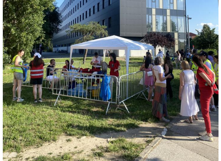
Punkt prve pomoći