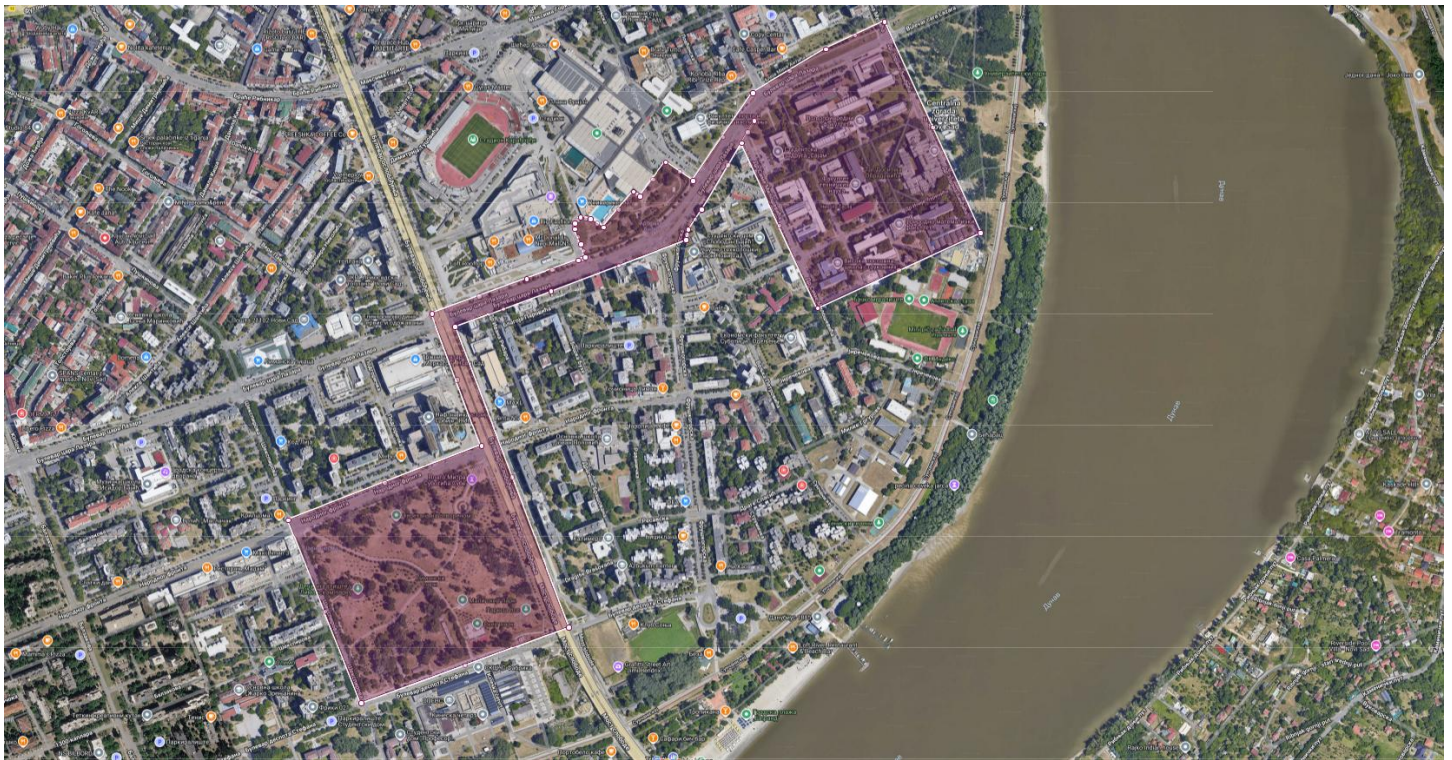
Površina zauzeta javnim okupljanjem studenata u Novom Sadu, 20. juna 2026. godine.

Konkretno javno okupljanje organizovano je od strane „Studenata u blokadi“ Univerziteta u Novom Sadu. Organizatori protesta okupljeni su u neformalnu grupu koja je nastala kroz saradnju plenuma fakulteta koji su učestvovali u blokadi. Zvaničan kontraskup nije bio prijavljen, niti formalno organizovan.