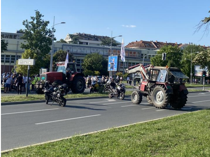
Traktori na protestu