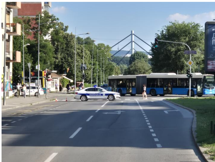
Policija na protestu