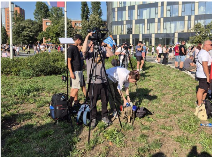
Mediji na protestu