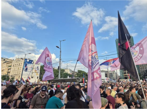
Zastave kvir zbora