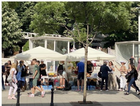
Punkt sa hranom i pićem