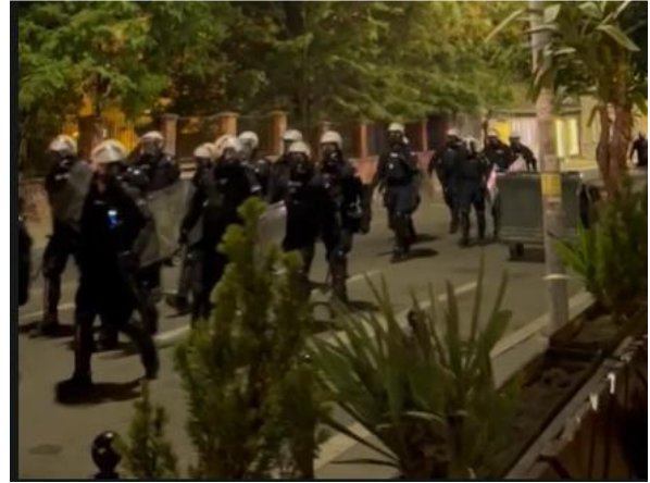
Jedinica policije na protestu