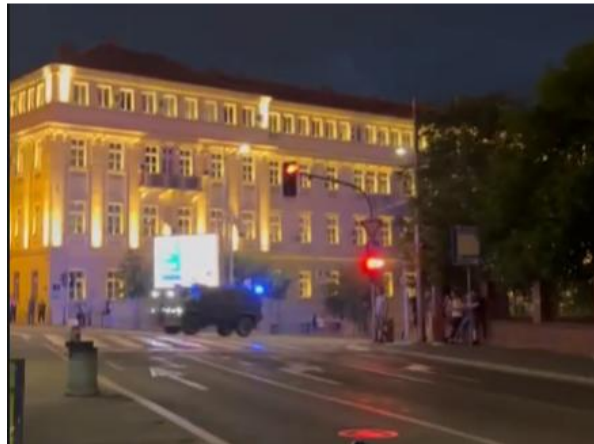
Specijalno vozilo policije na protestu