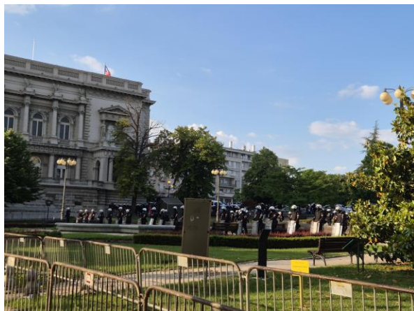
Policija ispred gradske skupštine