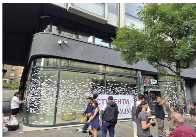
Zgrada EXPO oblepljena nalepnicama