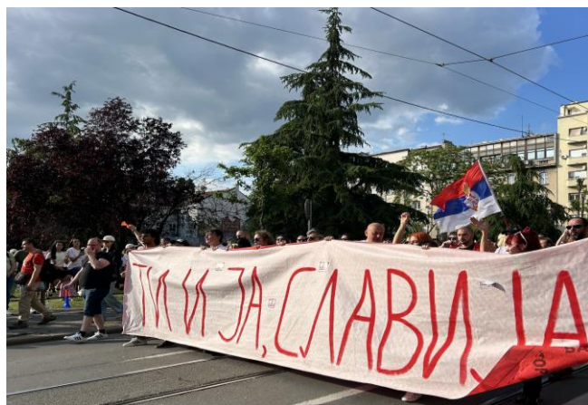
Transparent na čelu protesne kolone