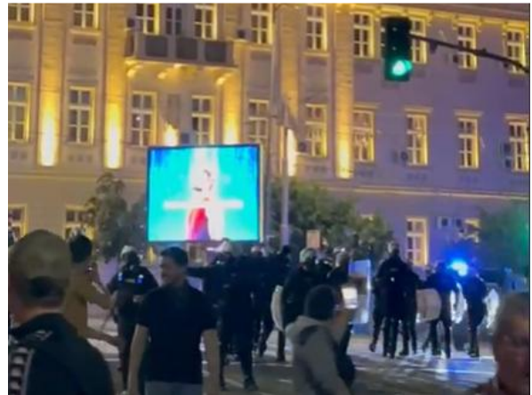
Policija potiskuje učesnike protesta