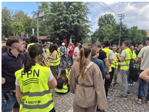
Redari na protestu